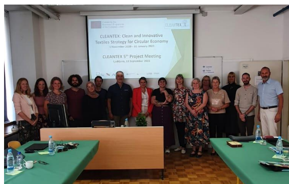
Cleantex partneriai susitikimo metu Liublijanoje

Po susitikimo partneriai galėjo aplankyti UL laboratorijas.