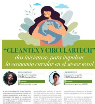
Leitat publication cover