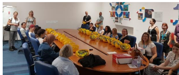
Estudiants durant la visita a una de les empreses

Per dotar l'experiència de més transversalitat i coneixement, UL va organitzar visites a empreses.