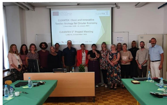
Socis del Cleantex durant la seva reunió a Ljubljana

Després de la reunió, els socis van poder visitar les instal·lacions i laboratoris de l' UL .